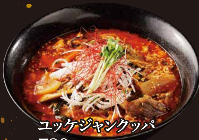
ユッケジャンクッパ