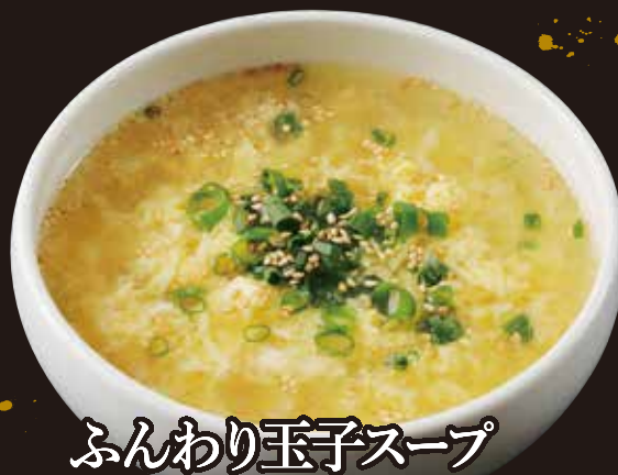
ふんわり玉子スープ