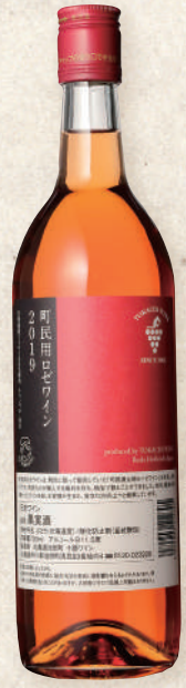
65 町民用 さわやかな ロゼワイン 720ml【辛口】

キャンベル種の爽やかな酸味と フレーバーな味わいは、まさに「ブ ドウのお酒」がイメージできる国産 では希少の辛口ロゼワインです。