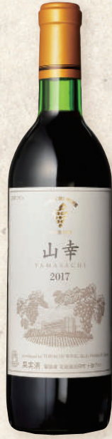
62 山幸 720ml【やや重め】

父親である山ブドウ譲りの草木 系の果実香、力強い酸味と野趣 あふれる味わいを持ち、秀でた個 性を有するワインです。