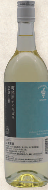
63 ナイアガラ 720ml【中辛口】

北海道産ナイアガラ種100%使用。フルー ティーなブドウの香りとスッキリと したさわやかな味が特徴の料理との 相性も良いや辛口の白ワインです。