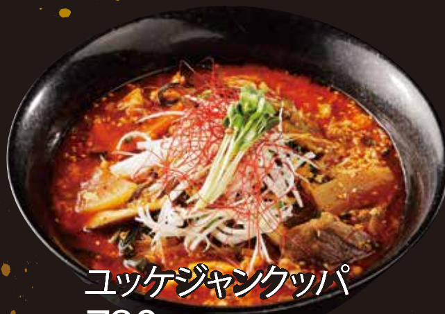
ユッケジャンクツパ